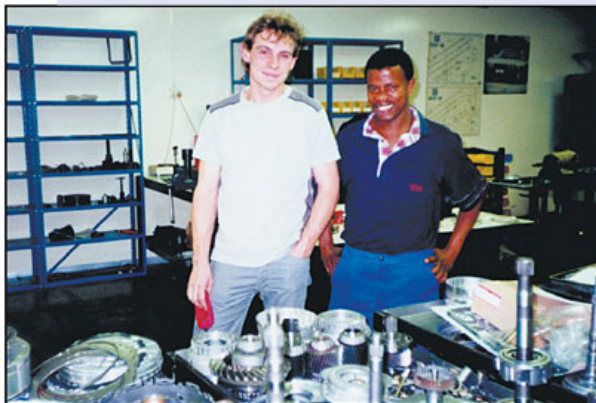
Montage in Johannesburg, Südafrika